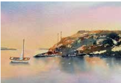
Målad av: Kerstin Dahmm

Låt dig inspireras av miljön och låt kreativiteten flöda.